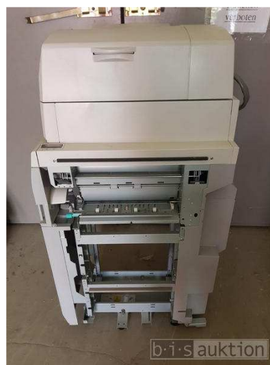
Document Insertion, Canon Unit F1, F280290, Bj. 2015

Alle Angaben basieren auf Informationen Dritter und sind somit ohne Gewähr weitere Informationen, Spezifikationen oder Besichtigung durch: