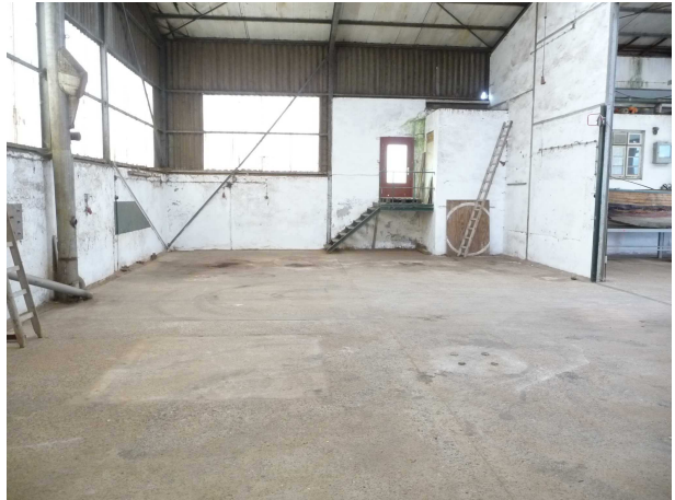
Innenansicht Werfthalle 2