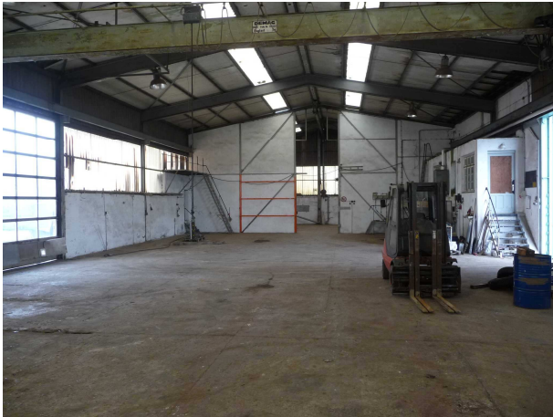
Innenansicht Werfthalle 1