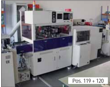
Pos. 119 + 120