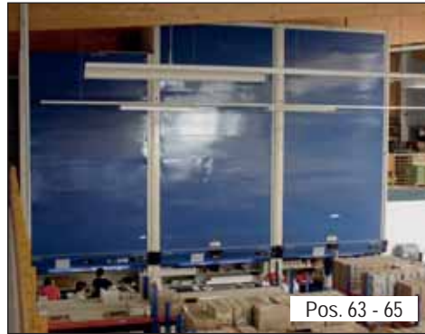
Pos. 63 - 65